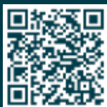
Podcast : Sélestat au fil des histoires