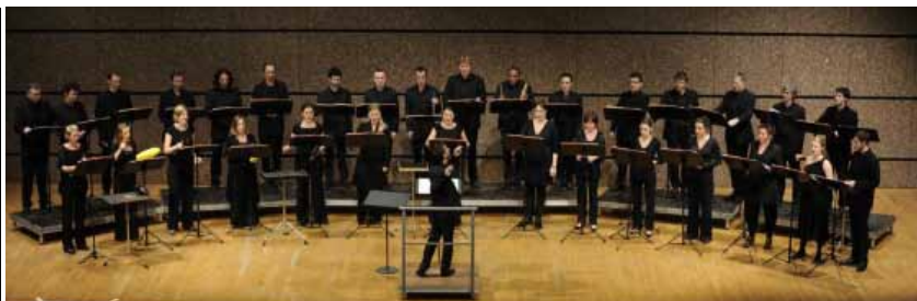
Ensemble Les Cris de Paris

Samedi 23 août | 20h30 | Abbaye de Moyenmoutier