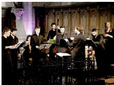
Ensemble Alia Mens