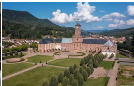
Abbaye de Moyenmoutier

Samedi 26 juillet | 20h30 | Abbaye de Moyenmoutier