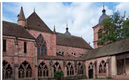
N.D. de Galilée | Cathédrale Saint-Dié

samedi 19 juillet | 20h30 | ND de Galilée