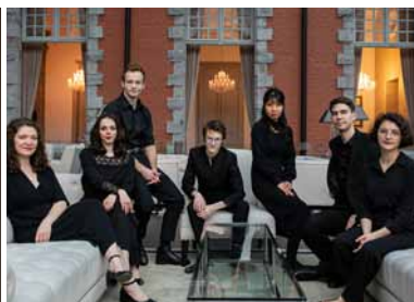
Ensemble La Nébuleuse