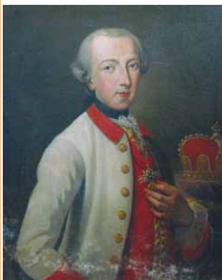
Leopold de Salm-Salm (Ville de Senones)

Le Festival des Abbayes, installé à Senones, se propose durant les années 2025, 26 et 27 d'évoquer cette relation avec les princes de Salm, et d'une manière plus générale avec ses voisins germaniques, depuis le Saint Empire jusqu'aux temps présents.