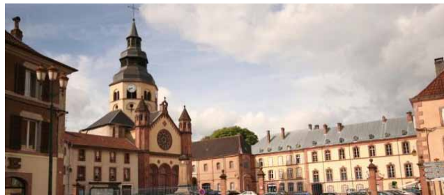
Abbaye de Senones

Samedi 05 juillet | 20h30 | Abbaye de Senones