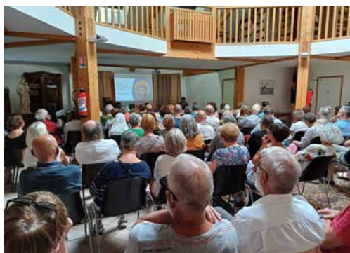
Rencontres, témoignages ou conférences attirent toujours beaucoup de public.

Cette saison 2025 sera particulièrement orientée vers le Saint Empire germanique qui a influencé la Lorraine et la principauté de Salm .