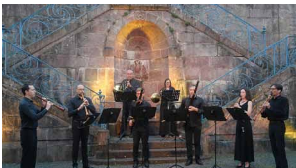
Escalier du palais de la Princesse Charlotte - Senones / Stradivaria