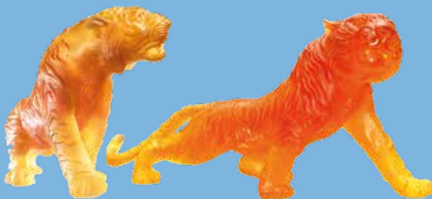
Tigre en pâte de verre Daum obtenu à partir d'un modèle en stratoconception réalisé par CIRTES sur le pôle VirtuReal à Saint-Dié-des-Vosges.

Chambre de Commerce et d'Industrie, du lundi au vendredi : 10 h - 12 h / 14 h - 17 h, sauf jours fériés. Ouverture exceptionnelle sam. et dimanches 10, 11, 17 et 18 septembre.