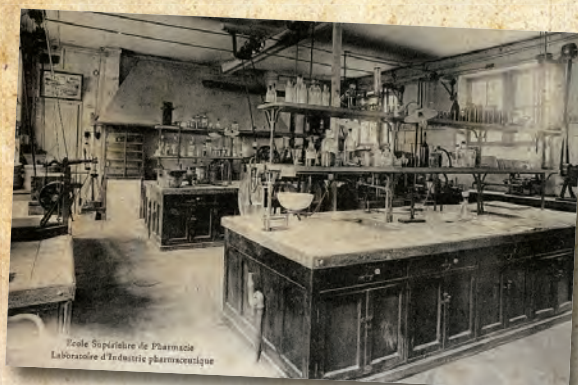
École Supérieure de Pharmacie Laboratoire d'Industrie pharmaceutique

Si les travaux sur l'armement et la fortification occupent une place conséquente, ils mettent en avant le renouveau de la recherche dans des domaines qui, contrairement à une idée commune, sont loin d'être épuisés par l'historiographie. Les communications sur la diffusion de la pensée intellectuelle, la formation et les transferts de technologie et l'économie mettent en lumière des aspects moins connus et témoignent de l'intrication des conflits dans l'ensemble du champ social.