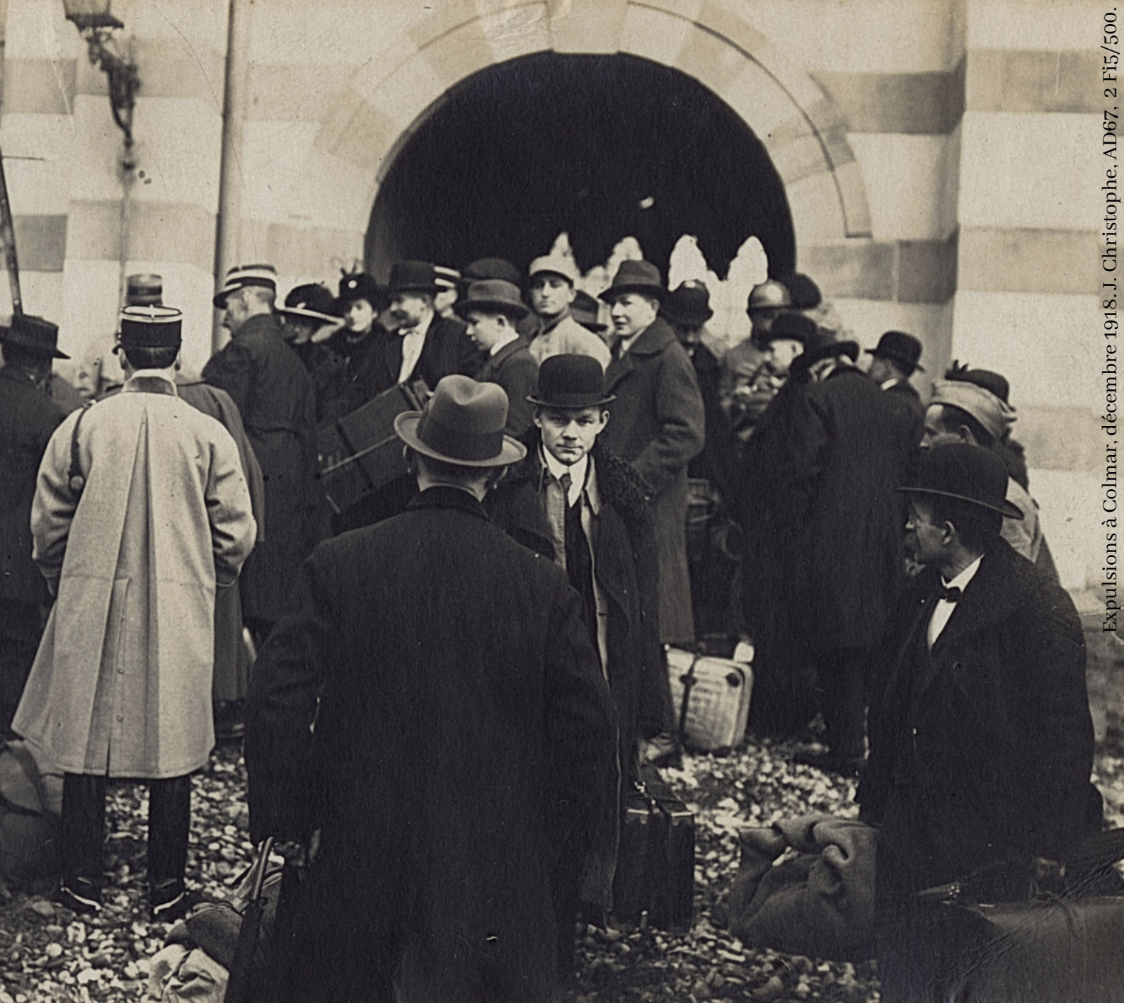
Expulsions à Colmar, décembre 1918. J. Christophe, AD67, 2 F15/500.

ARCHIVES DÉPARTEMENTALES DU BAS-RHIN UNIVERSITÉ DE STRASBOURG