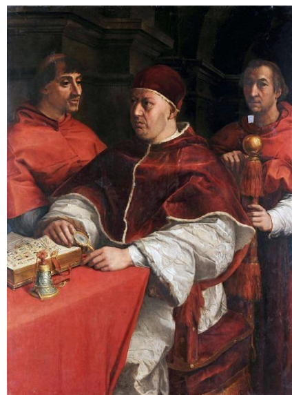
Andrea del Sarto, copie, Naples, Museo Nazionale di Capodimonte