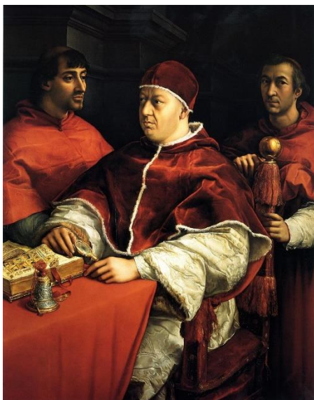
Raphaël, Portrait du pape Léon X et des cardinaux Giulio de Médicis et Luigi de Rossi, Florence, Offices